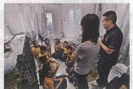
除了照顧小貓起居飲食，「愛貓組」還開展了一系列生命教育活動。