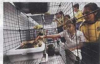
每次上「貓課」，同學都十分雀躍。

至於學校其他老師亦會將小貓融入教學，例如上中、英文課堂時，同學會學習寫信給小貓；上視藝課時，以貓為題作素描對象等等。